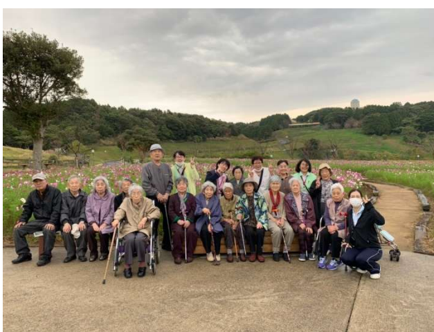
10月コスモス見学 (あぐりの丘)